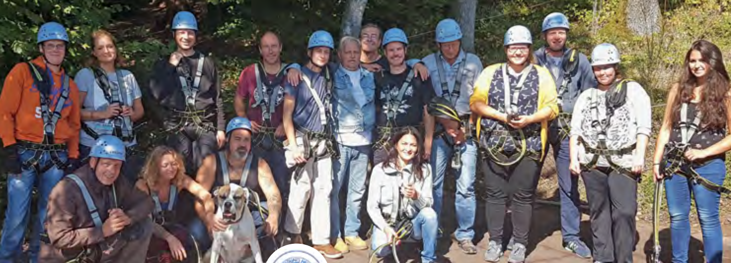
Ein gemeinsamer Ausflug in den Kletterwald